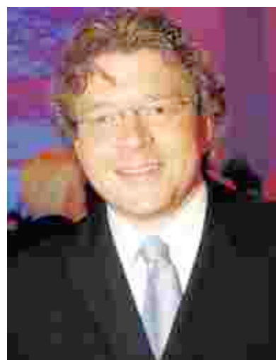
Garant für hohen musikalischen Anspruch: Aachens GMD Marcus R. Bosch.

Infos im Internet: www.kurparkclassix.de