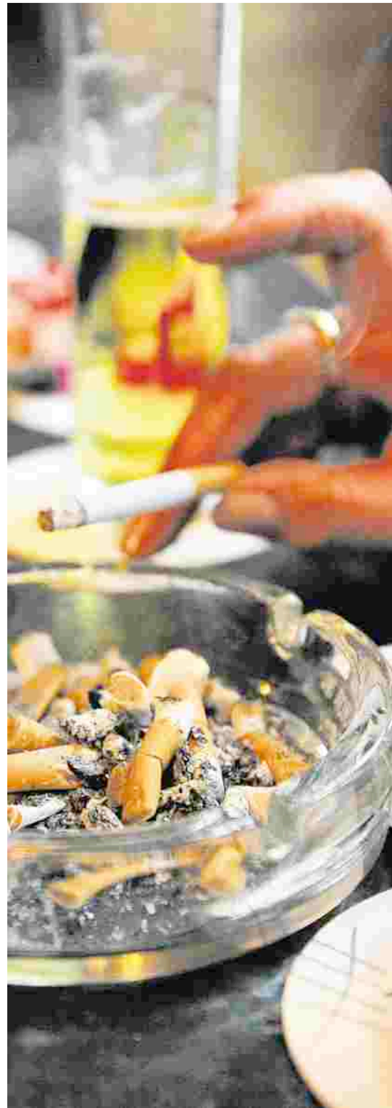
Kneipenidylle oder rücksichtsloses Verhalten gegenüber Nichtrauchern: Die Meinungen gehen auseinander, was für eine angenehme Atmosphäre an Theke oder Gaststisch unerlässlich ist.